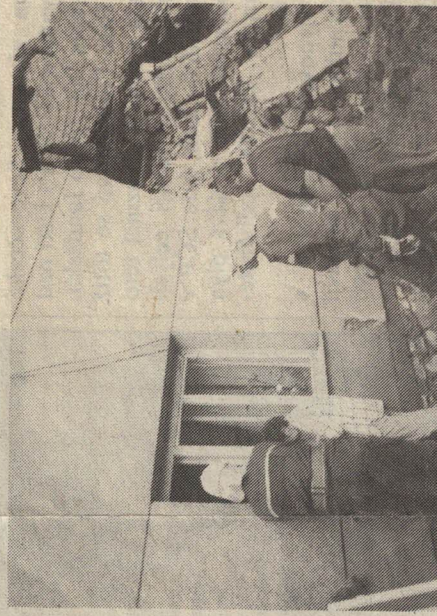
Cítolibští hasiči pomáhají ve zničených Troubkách - vlevo smutný pohled na jednu z ulic, vpravo hasiči při akci.

neustále projížděla sanitka. Beževně fungovala také místní provizorní jídelna, kde kuchařky vařily okolo jednoho tisíce obědů denně. Šlo o jediné teplé jídlo. Večeře se odbývala venku a každý jedl, co si pro ten den vzal ze skladu potravin.